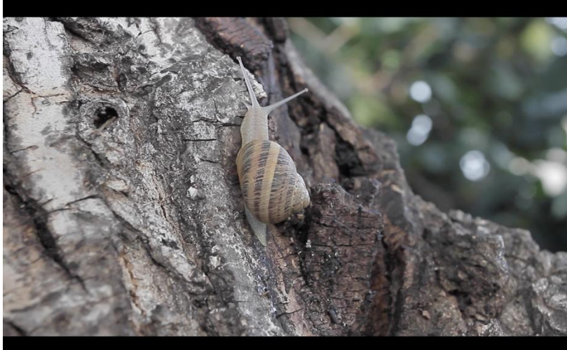
El caracolcito. Vídeo instal.lació